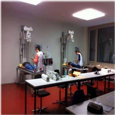
Sprechstundenassistentenz / Therapeutik (SSA/THE)